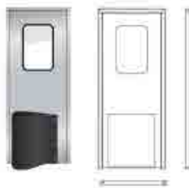
不锈钢防撞自由单开门

净化门其外观精美，坚固耐用，开启灵活。用户根据需求选用铝合金材料、不锈钢材料和自动封闭装置，以防止昆虫和其他小动物进入洁净厂房，还可以任意选定可视窗型式、尺寸以及门板颜色和门锁型号。