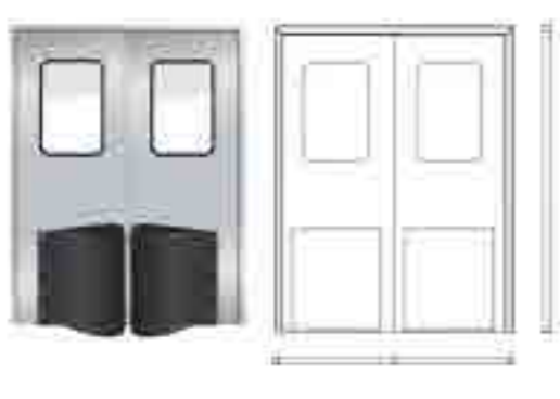
不锈钢防撞自由门